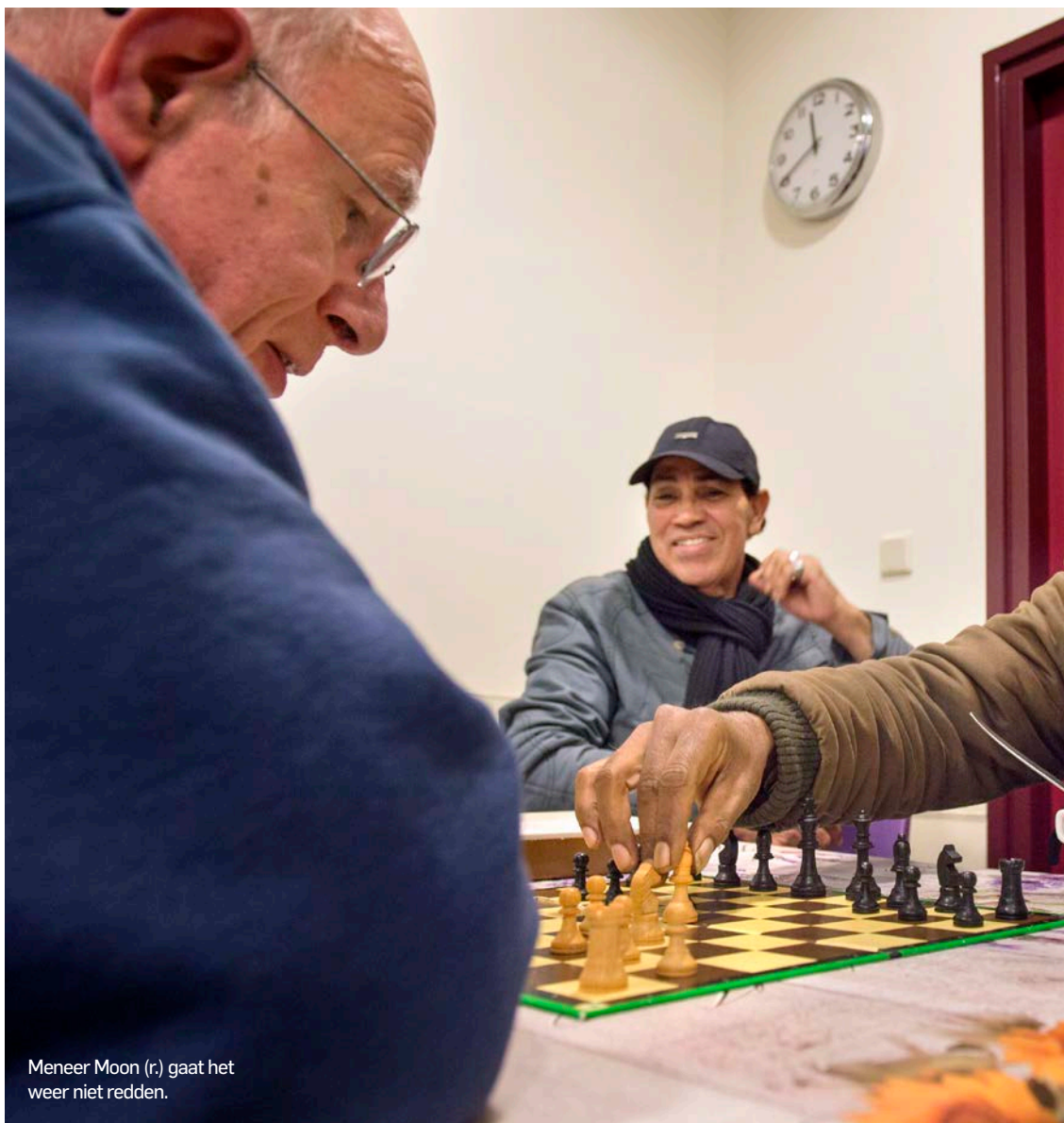
Meneer Moon (r.) gaat het weer niet redden.

Voor elke persoon extra in het huishouden wordt het limietbedrag verhoogd met € 85. Ook geldt: niet langer dan drie jaar achter elkaar bij de Voedselbank en dan een jaar