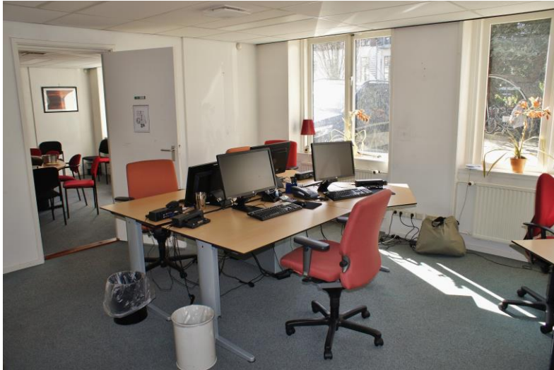
Ruimte 2 Begane grond