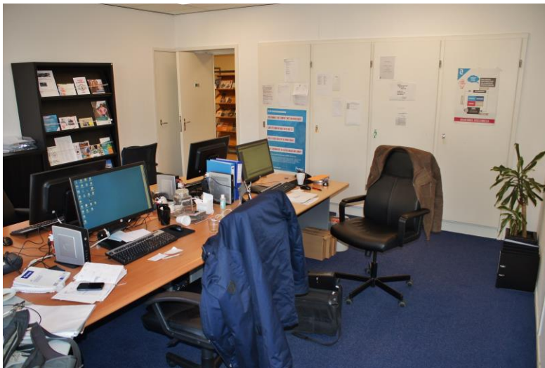
Ruimte 1 Eerste verdieping