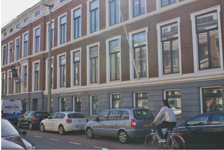
Voorbeeld Parkstraat 32