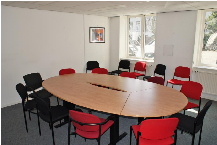
Ruimte 1 Begane grond

Voor meer informatie kunt u contact opnemen met Sandra de Vreede, hoofd bedrijfsbureau, sdevreede@pkn-den Haag.nl , (070) 318 1684.